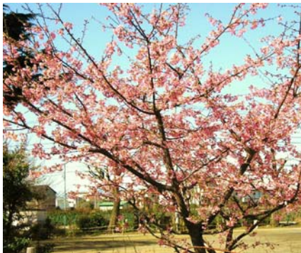
河津桜=矢川上公園